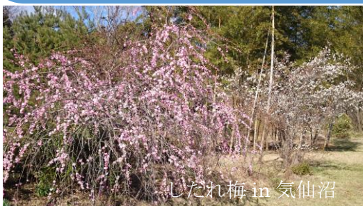
しつれ梅 in 気仙沼

一般財団法人訪問リハビリテーション振興財団 気仙沼訪問リハビリステーション TEL : 0226-25-8323 FAX:0226-25-8324