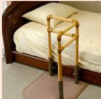
据え置き型手すり