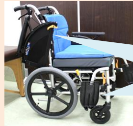
跳ね上げ式車椅子