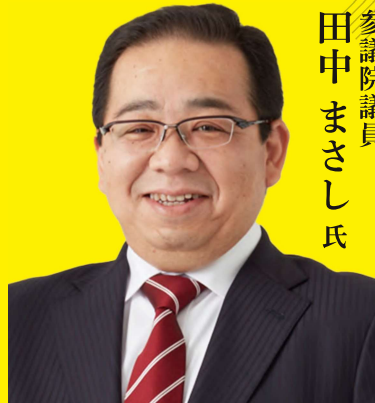
参議院議員 田中まさし氏